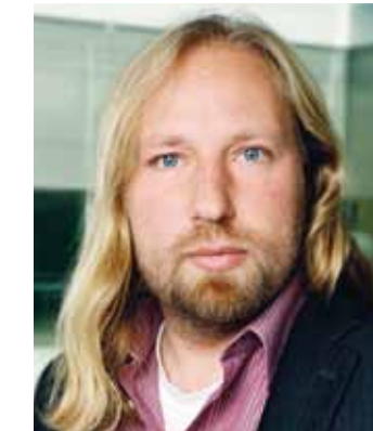
Dr. Anton Hofreiter, BÜNDNIS 90/ DIE GRÜNEN Vorsitzender des Ausschusses für Verkehr, Bau und Stadtentwicklung

„Als Ausschussvorsitzender will ich mich dafür einsetzen, dass der Ausschuss produktiv und zielorientiert arbeitet. Er soll ein Ideengenerator auf dem Weg zu nachhaltiger Mobilität werden. Und natürlich soll er klima- und sozialverträgliche Verkehrs- und Baupolitik vorantreiben.“